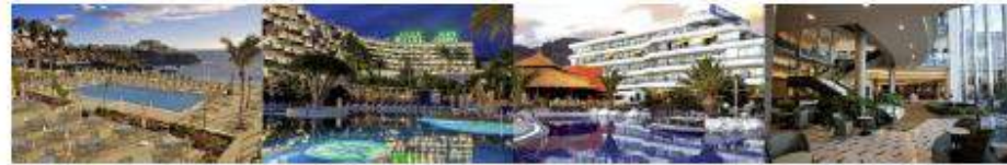
Imagen: Establecimientos hoteleros.

Si bien la oferta hotelera de Puerto Santiago comparte la madurez de la planta de alojamiento, su estado de conservación es aceptable, presentando a menudo obras de conservación y mejora parcial. No obstante, la problemática de la oferta hotelera se centra en la ausencia de establecimientos de mayor categoría y de equipamientos complementarios en las instalaciones de los hoteles que mejoren esta oferta.