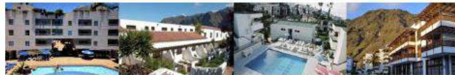
Imagen: Establecimientos extrahoteleros.

El ámbito turístico ha experimentado una pérdida progresiva de plazas de alojamiento debido a la residencialización total o parcial de establecimientos de alojamiento, provocando la aparición de establecimientos mixtos donde coexisten usos turísticos y residenciales, la atomización de la propiedad.