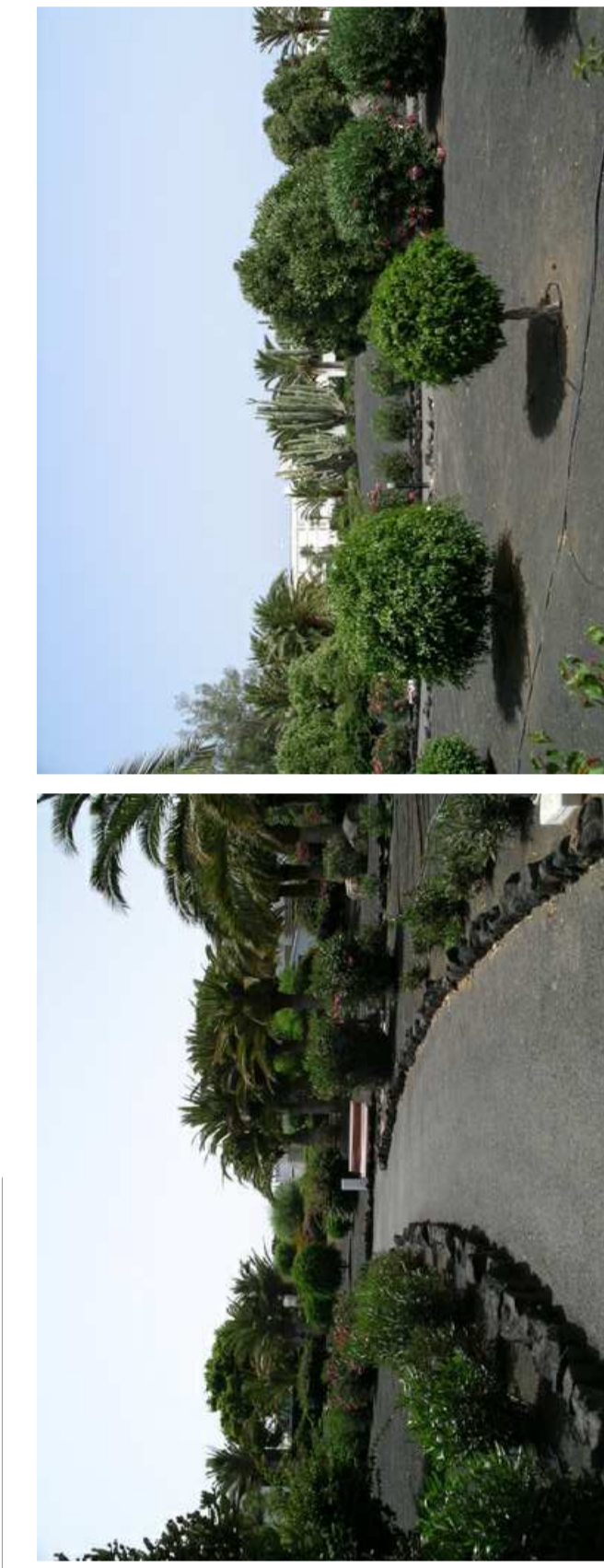
AMON HOTEL EN OUBRA - AJORNAMIENTO EN BIEN ESTADO