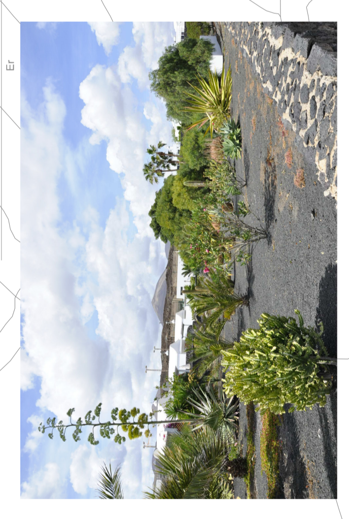
PARQUE COSTERO CALLE SAIZA - ESPACIO LIBRE TRAZADO - AJORNAMIENTO EN BIEN ESTADO