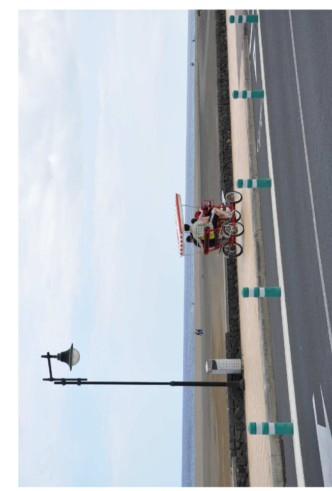
PLAYA DE LOS POZILLOS