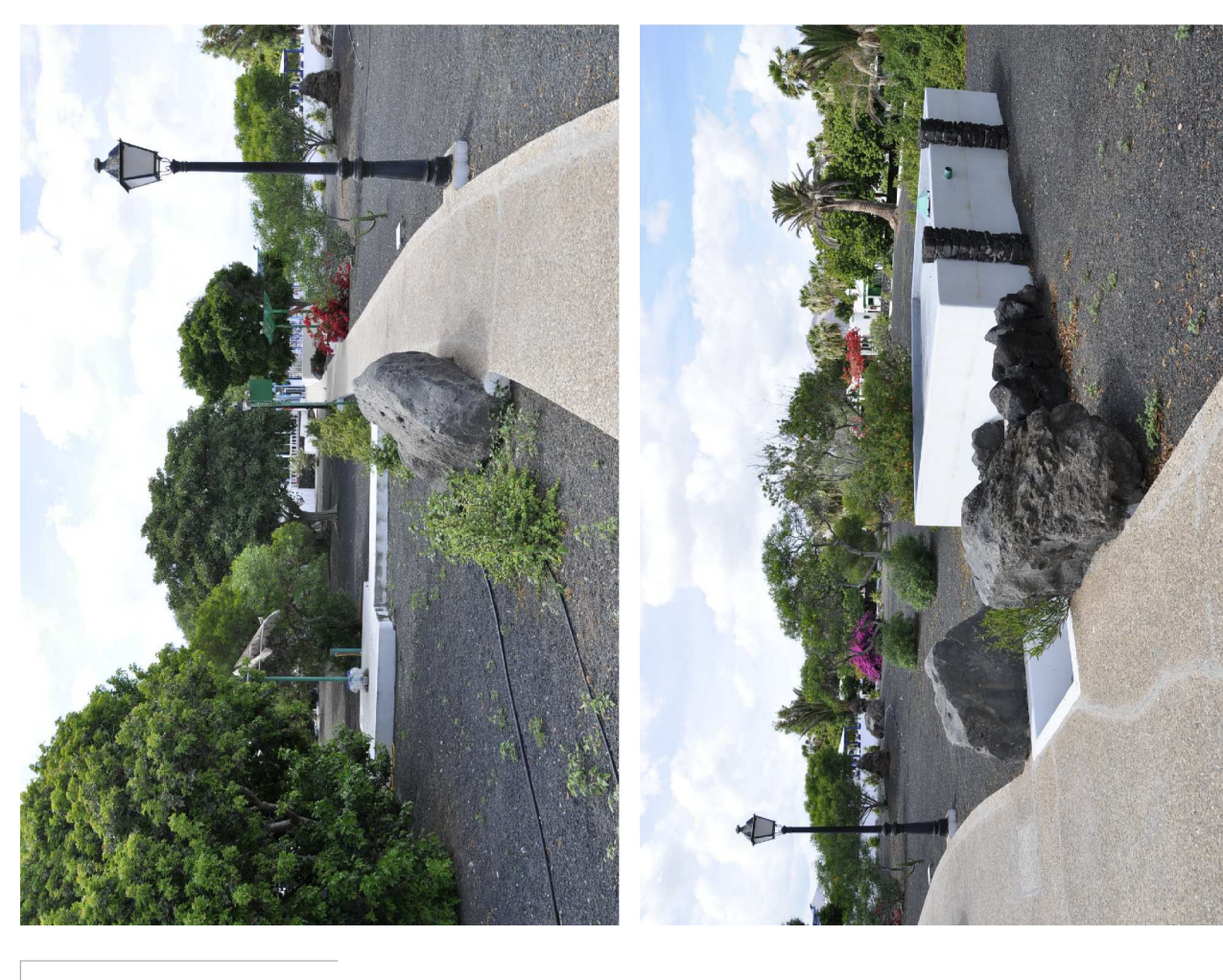
PARQUE URBANO AJORNAMIENTO TIPOE PARK LANE - ESPACIO LIBRE TRAZADO - AJORNAMIENTO EN BIEN ESTADO