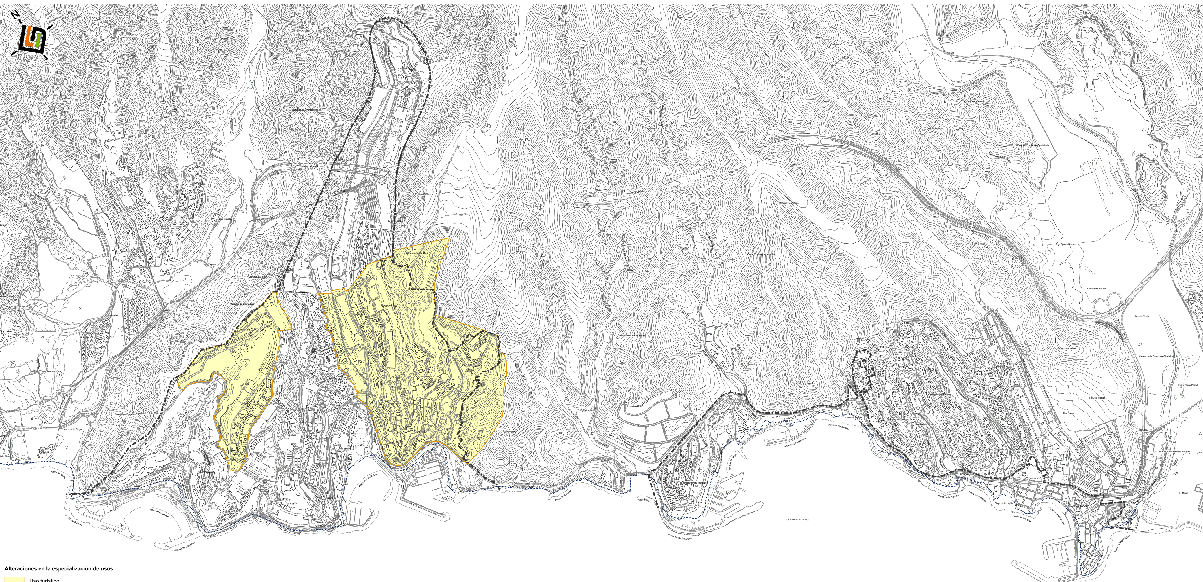
Alteraciones en la especialización de usos Uso turístico